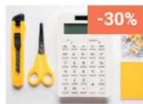
Fournitures de bureau