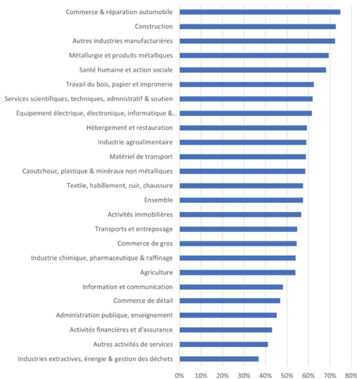
Part de recrutements difficiles en 2024 par secteur