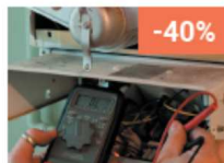
Contrôles réglementaires & sécurité incendie