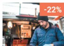
Maintenance et entretien