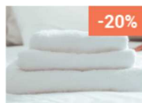
Entretien du linge et EPI