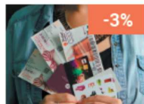
Outils de motivation